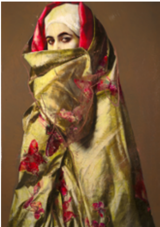
Lita Cabellut - Een kroniek van het oneindige