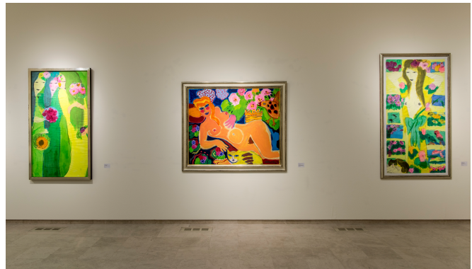
Walasse Ting – The Amsterdam Years