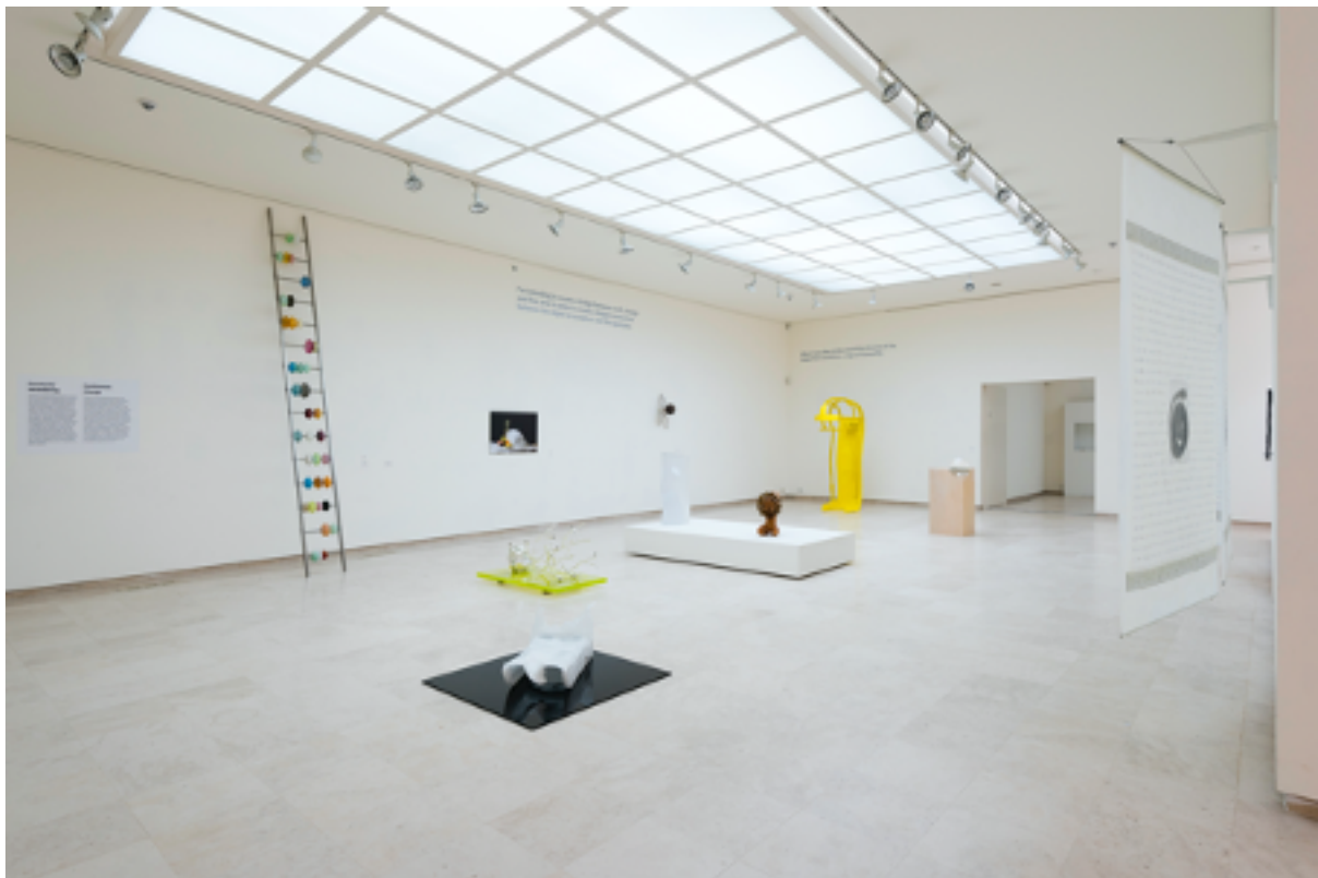
50 jaar glas aan de Rietveld Academie

Hierbij een impressie van de tentoonstellingen in 2018 waar de Vriendenactiviteiten omheen zijn georganiseerd.